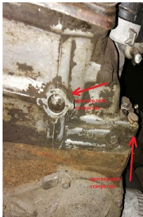
Двигатель ВАЗ 2101-06