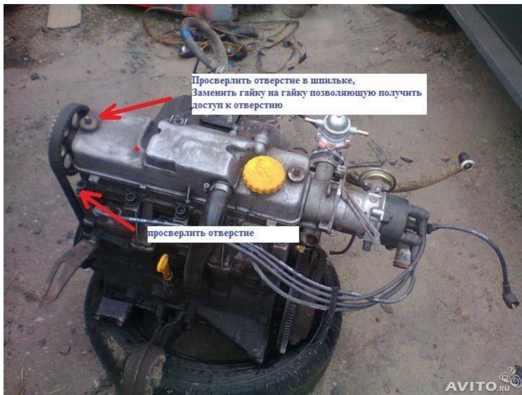
Двигатель ВАЗ 2108