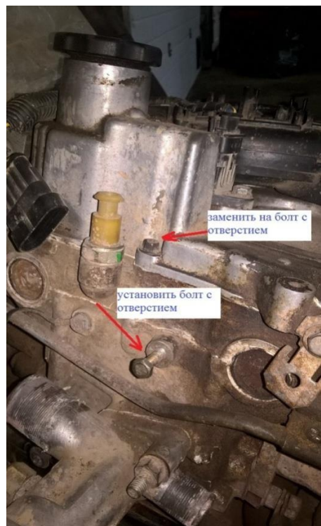
Двигатель ВАЗ 21124, 21126